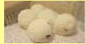
Abb. ähnlich - Farbe hellblau

FONTAINE BOULE LAVENDEL Sprudelkugel zum genussvollen und hautpflegenden Baden, mit Jojobaöl, Lavendelduft